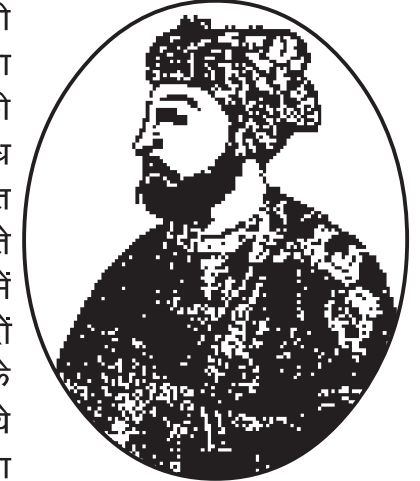
सआदत ख़ाँ बुरहानुलमुल्क