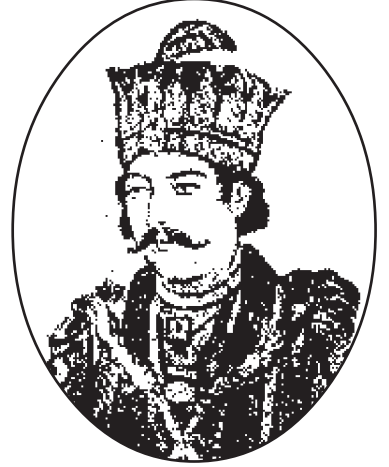
मुहम्मद अली शाह