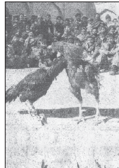
मुर्गों की लड़ाई का दृश्य